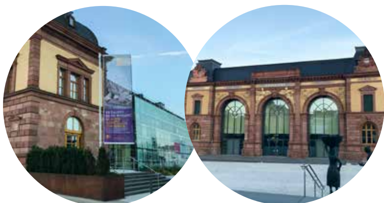
Forum Alte Post

Einmalig in Rheinland-Pfalz ist das Mitmachmuseum „ Dynamikum “. Mit fast einer Million Besuchern in den ersten zehn Jahren begeistert es nicht nur große und kleine Entdecker, Experimentierer und Wissbegierige, es ist auch außerschulischer Lernort und Anziehungspunkt für viele Touristen, die sich spielerisch mit technischen und naturwissenschaftlichen Phänomenen beschäftigen, mit garantiertem Unterhaltungs- und Spaßfaktor. Mit dem Strecktalpark , direkt vor dem Dynamikum gelegen, präsentiert die Stadt eine Erholungsoase mitten in der Stadt und zeigt gleichzeitig, wie man eine Industriebrache umgestalten kann. Mit der Sanierung des Bahnhofs und der Alten Post vor einigen Jahren wurde das Bahnhofsviertel deutlich aufgewertet, und wenn 2019 die Jugendherberge und das Jugendhaus in die alte Hauptpost einziehen, wird der ganze Bereich mit neuem, jungendlichem Leben erfüllt. Geplant ist, dass auch die Kaufhalle wieder in neuem Glanz erstrahlt. Wir wollen eine einladende Stadtbücherei und ein neues Stadtarchiv . Beide Einrichtungen sind wichtig für die Kultur in unserer Stadt.