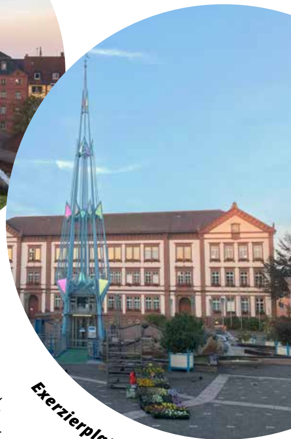
Exerzierplatz & Wochenmarkt