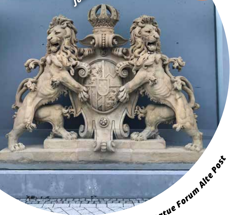
Löwenstatue Forum Alte Post

Verfolgen Sie unsere Aktivitäten im Netz unter www.fwb-pirmasens.de und auf Facebook