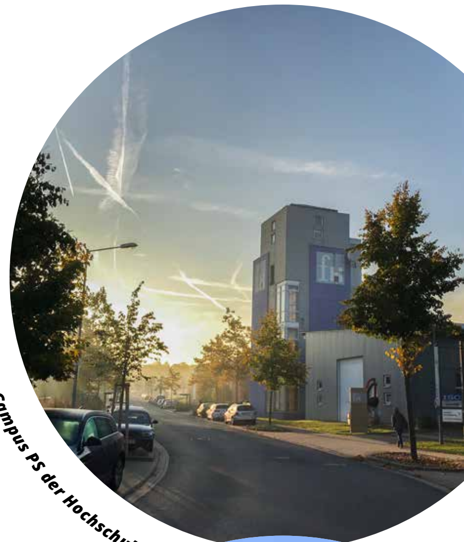
Campus PS der Hochschule

Der Ehrenamtstag im August 2018 hat beeindruckend die Bandbreite der Ehrenämter gezeigt. Ohne ehrenamtliches Engagement wäre unser Leben in der Stadt lange nicht so bunt und vielfältig, aber wir müssen die Leistung der Menschen auch schätzen und anerkennen und darauf achten, dass Ehrenamtliche keine Aufgaben übernehmen, die der Gesetzgeber dem Land oder der Kommune vorgegeben hat.