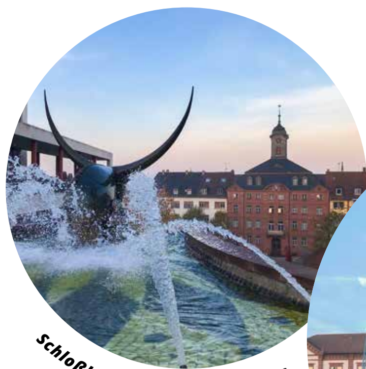
Schloßbrunnen & Altes Rathaus

Wir freuen uns auf den Dialog mit Ihnen! Ihr FWB Pirmasens.