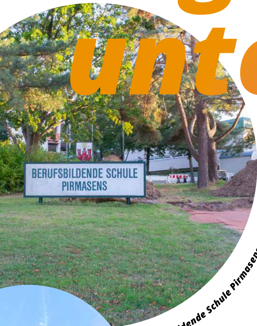
Berufsbildende Schule Pirmasens