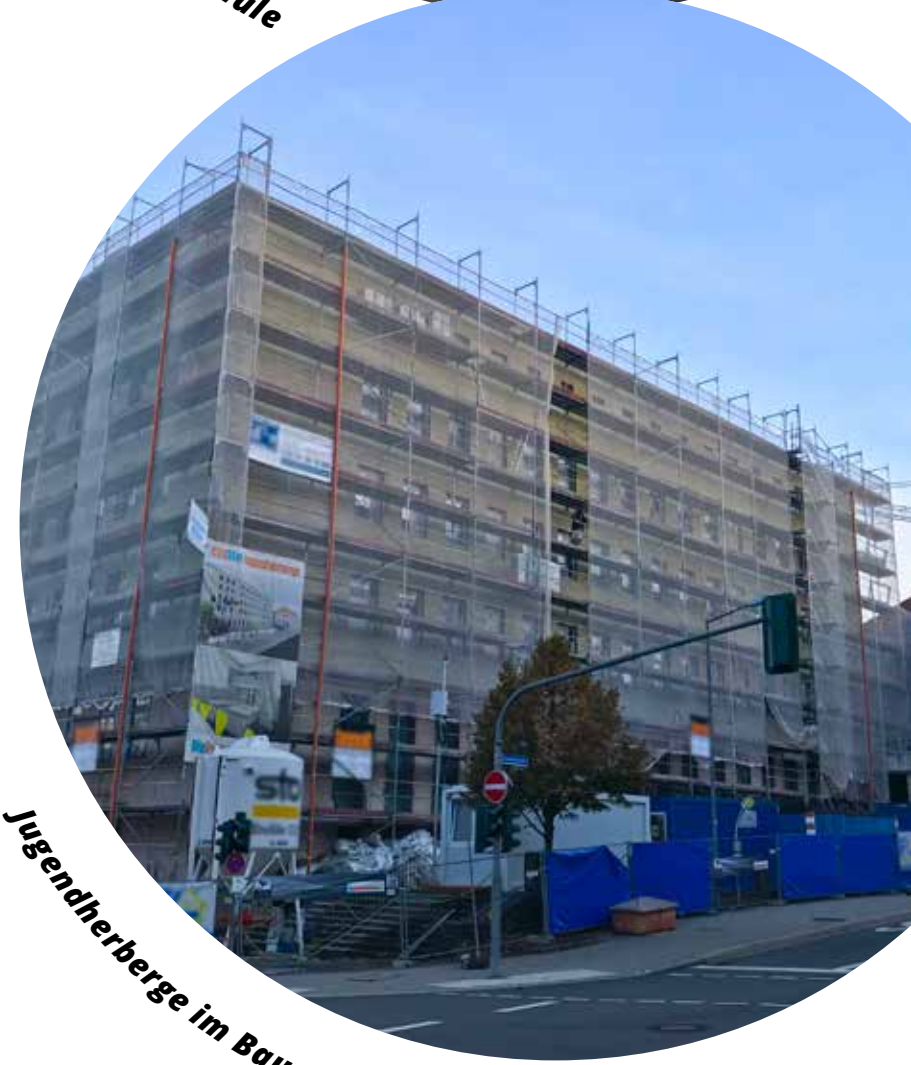
Jugendherberge im Bau